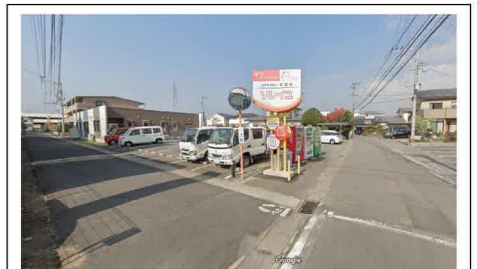
⑫ ソレイユの看板が目印