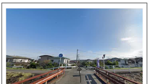
⑨ 橋を渡ってからは直進