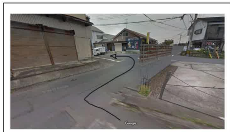
⑤ 大塚フーズ (大分とり天) を左折