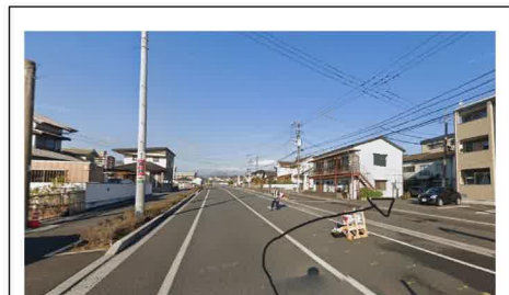
⑪ 焼き鳥丸八の看板を右折